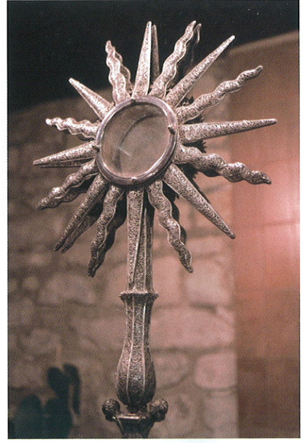
Anónimo. Cristo expirante y Custodia . XVII. Filipinas. Caicedo de Yuso, Álava.

Numerosos son los conjuntos textiles procedentes de Filipinas conservados en España, aunque escasos son los documentados, como ocurre con algunos que encontramos en el País Vasco y Navarra.