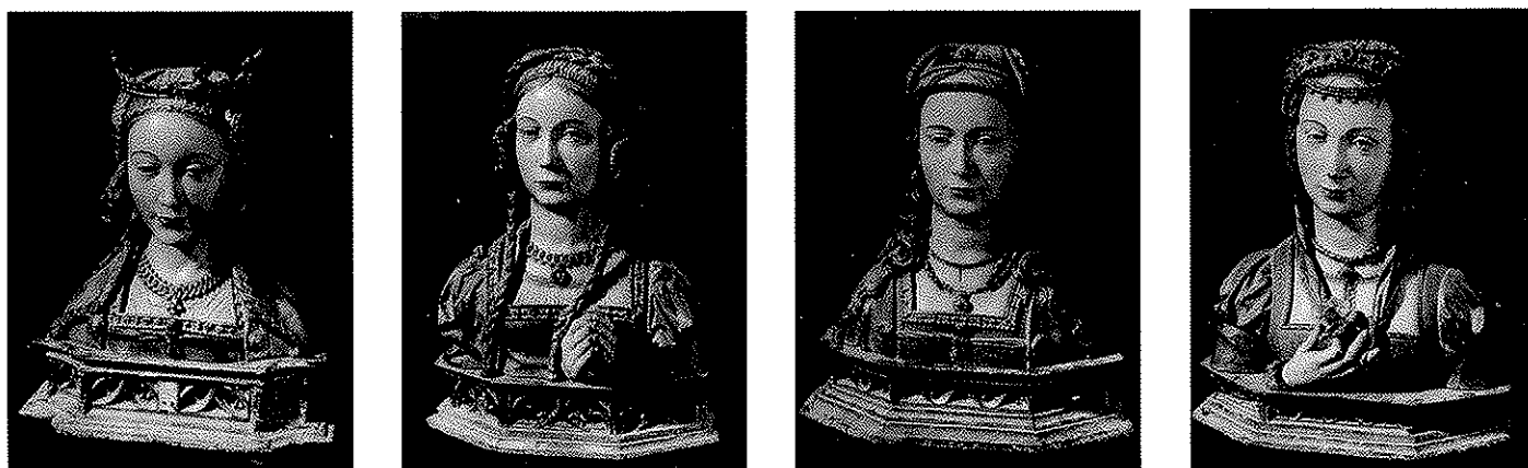
Colección de Bustos - Relicario de El Salvador de Úbeda (Jaén). Desaparecidos, salvo el primero durante la Guerra Civil