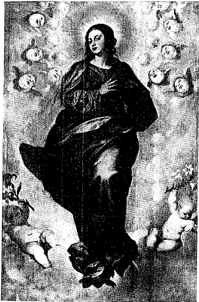
Inmaculada, por Alonso Cano. (Museo Provincial, Vitoria, Álava).