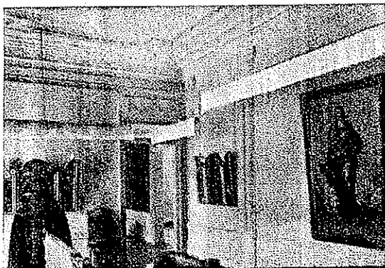
Vista de una sala. (Museo Provincial, Vitoria, Álava).

A la derecha, comienza el itinerario de las salas del primer piso. En la primera, se exponen: una buena talla dorada y policromada de la Vir-