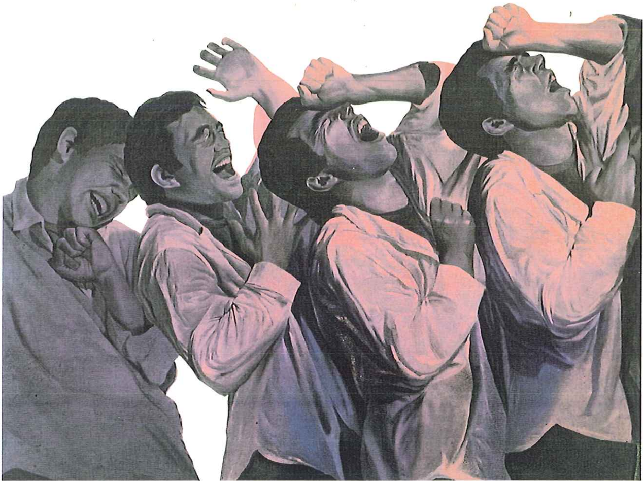
41. El grito, 1977 Acrílic sobre tela, 90x120 cm