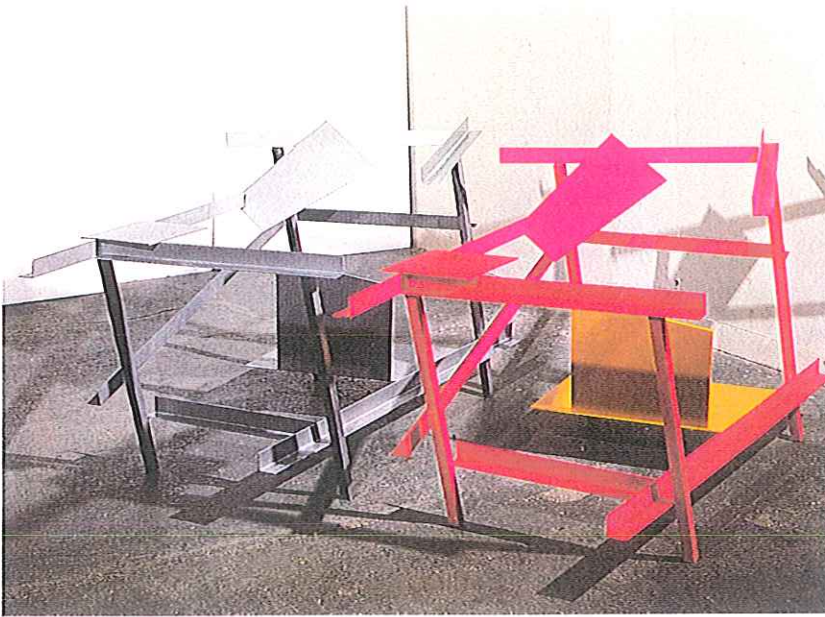
TWINS III, 1988-1989, ACERO PINTADO, 2 PARTES DE 91 x 170 x 98 cm CADA UNA