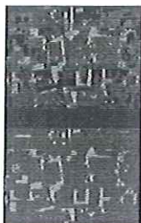
Sedimentación- Estructuración C

Fumando duplex más espacio abierto y Sedimentación-Estructuración C son dos obras realizadas entre 1975 y 1976 que presentan características frecuentes en la obra de Gordillo de los años setenta: la repetición, la duplicidad, el carácter narrativo, la distorsión, la utilización de colores fríos y de imágenes de los medios de comunicación, etc. Ambas tienen composiciones compartimentadas en las que se duplica el motivo, presentado en una versión coloreada y otra en grises. El dibujo y el collage estructuran la composición, combinando planos y formas geométricas con otras partes más orgánicas.