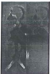
Fumando duplex más espacio abierto

Esta exposición muestra obras de dos períodos diferentes: