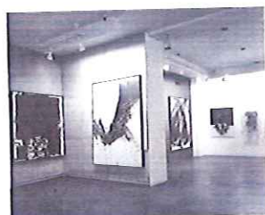
Exposición Four Spanish Painters , PIERRE MATISSE GALLERY, Nueva York, marzo-abril, 1960. A la izquierda CUADRO 67, 1959, a la derecha obras de Rafael Canogar y Manuel Rivera.