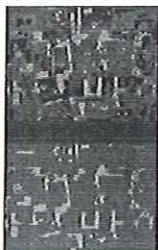
Sedimentación- Estructuración C

Fumando duplex más espacio abierto y Sedimentación-Estructuración C son dos obras realizadas entre 1975 y 1976 que presentan características frecuentes en la obra de Gordillo de los años setenta: la repetición, la duplicidad, el carácter narrativo, la distorsión, la utilización de colores fríos y de imágenes de los medios de comunicación, etc. Ambas tienen composiciones compartimentadas en las que se duplica el motivo, presentado en una versión coloreada y otra en grises. El dibujo y el collage estructuran la composición, combinando planos y formas geométricas con otras partes más orgánicas.