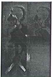
Fumando duplex más espacio abierto

Esta exposición muestra obras de dos períodos diferentes: