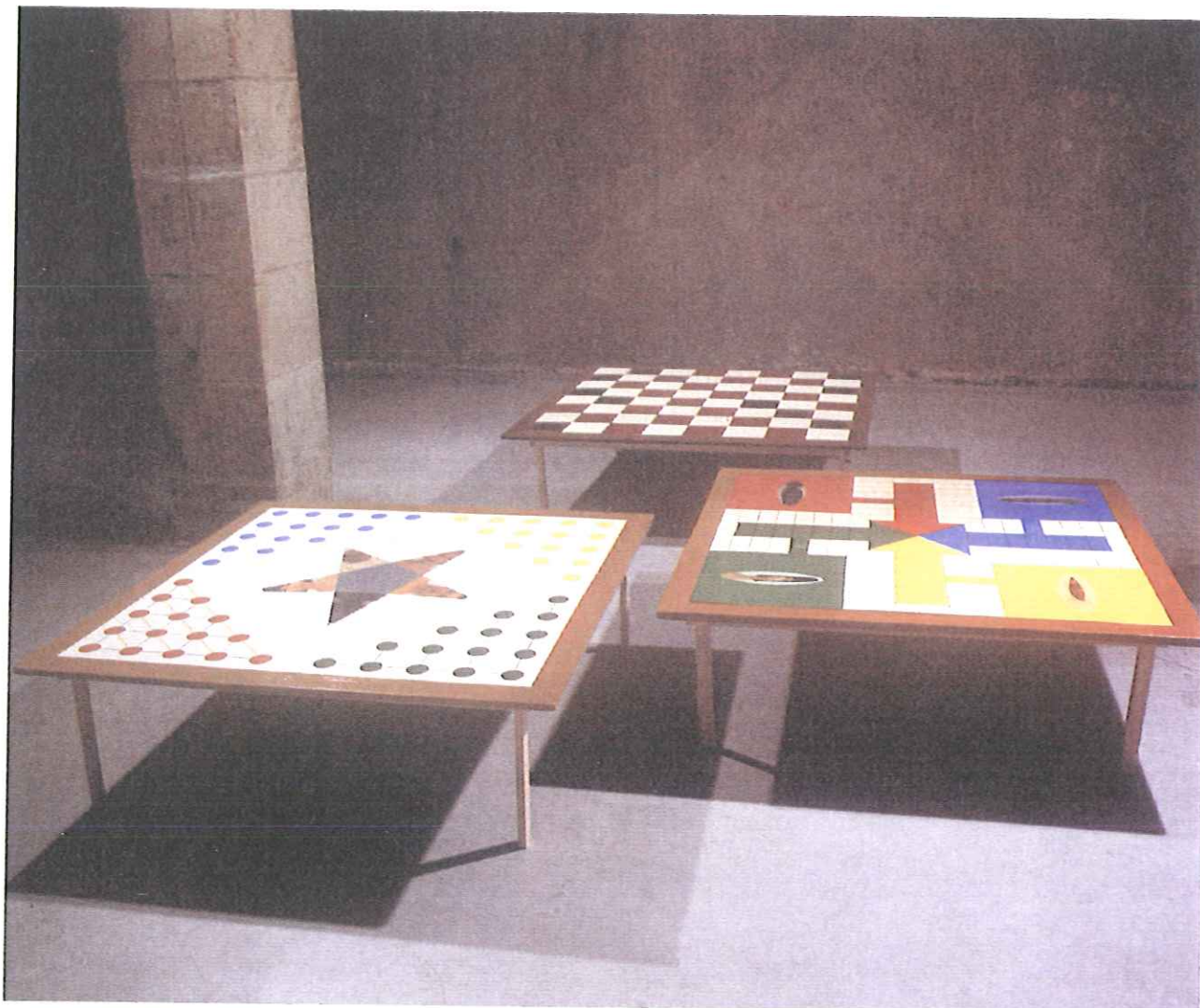
MESAS DE JUEGO 1995 - 97 Mixta s / madera 3 piezas 171X 171 X 50 cm. (c. u.)