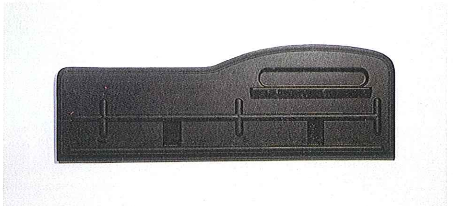
Fernando y Vicente ROSCUBAS (Bilbao, 1953) Sol de levante. 1995-96 Acrílico, madera, poliéster 100 x 294 x 12 cm