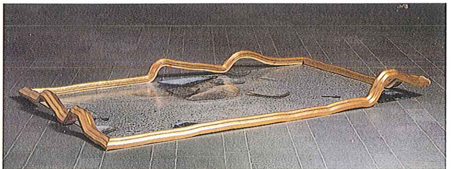
PEREJAUME (Sant Pol de Mar, Barcelona 1957). Platja. 1990 Fotografía, moldura, metacrilato 28 x 205 x 365 cm