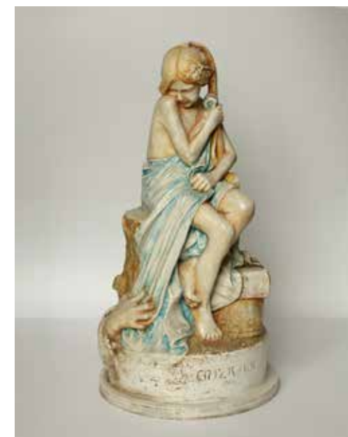
Euzkadi, 1907ko Bartzelonako Nazioarteko Erakusketara aurkeztutako obra. Euzkadi , obra presentada a la Exposición Internacional de Barcelona de 1907.

Como la mayor parte de los escultores del momento, Fernández de Viana toca todos los géneros escultóricos y emplea materiales muy diversos. Destaca su labor como autor de escultura conmemorativa con el desaparecido monumento a Felipe Dugiols en Tolosa (Gipuzkoa). Hay que mencionar también su labor dentro de la escultura funeraria, costumbrista, de retratos y especialmente en la escultura religiosa. Es en este apartado donde desarrolla una obra más abundante aunque en ocasiones menos libre al estar sometido al encargo. Respecto a los materiales, además de la piedra, la madera y el mármol, el escultor utiliza muchas veces la