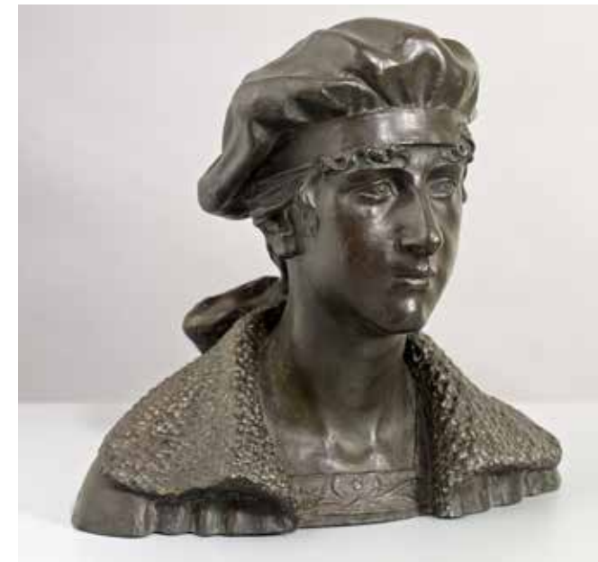
Nire alaba. Mi hija. Hacia 1916-1920 aldera Arabako Arte Ederren Museoa. Museo de Bellas Artes de Álava