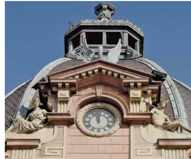
Nekazaritzaren eta Merkataritzaren irudiak. 1916 inguruan. Imágenes de la Agricultura y el Comercio. Hacia 1916. Estación Constitución, Buenos Aires (Argentina)