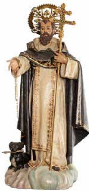
Santo Domingo de Guzmán.

Farolen Museoa Museo de los Faroles, Vitoria-Gasteiz