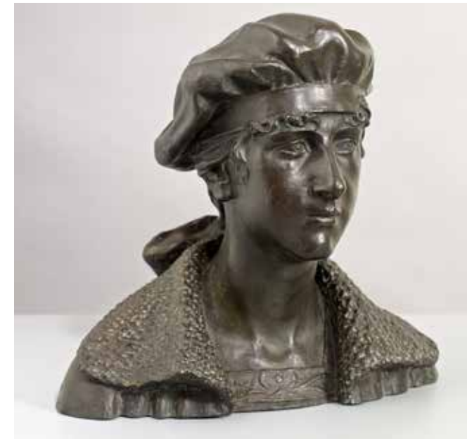
Nire alaba. Mi hija. Hacia 1916-1920 aldera Arabako Arte Ederren Museoa. Museo de Bellas Artes de Álava