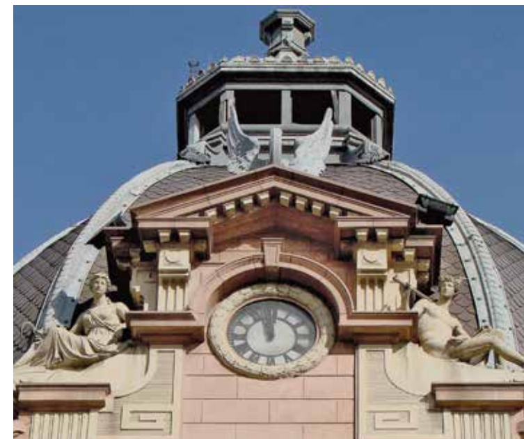
Nekazaritzaren eta Merkataritzaren irudiak. 1916 inguruan. Imágenes de la Agricultura y el Comercio. Hacia 1916. Estación Constitución, Buenos Aires (Argentina)